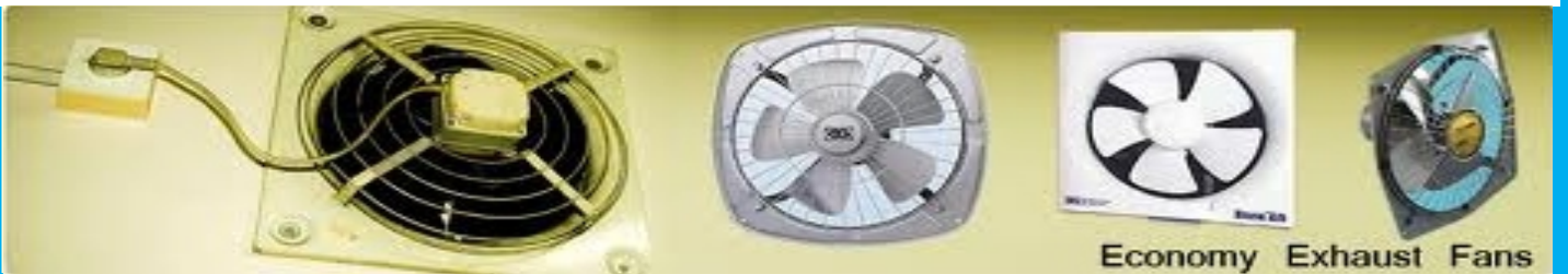
Economy Exhaust Fans

ટેબલફેન, સીલીંગફેન, પેડેસ્ટલ, તથા એક્ઝોસ્ટ ફેન, ગીઝર, ઇલેક્ટ્રિક મોટર, સબમર્સીબલ પંપ ટ્યુબલાઈટ, બલ્બ, ટોર્ચ, સોલર ટોર્ચ, CFL, ઇલેક્ટ્રિક ફીટીંગ સામાન, સ્પીચ, વાયર, વલોણાચંત્ર, ઇસ્ત્રી