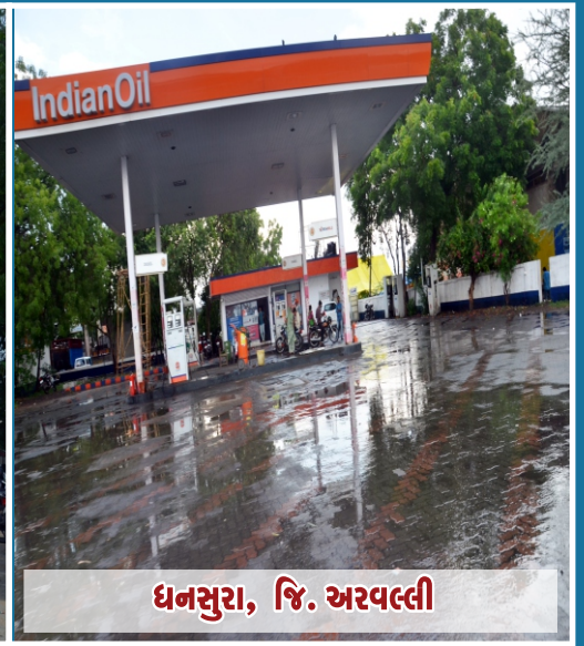
ધનસુરા, જિ. અરવલ્લી