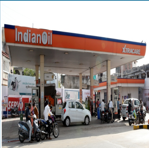
મહાવીરનગર, હિંમતનગર, જિ. સાબરકાંઠા.