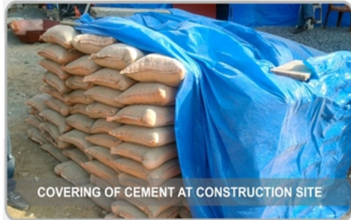
COVERING OF CEMENT AT CONSTRUCTION SITE