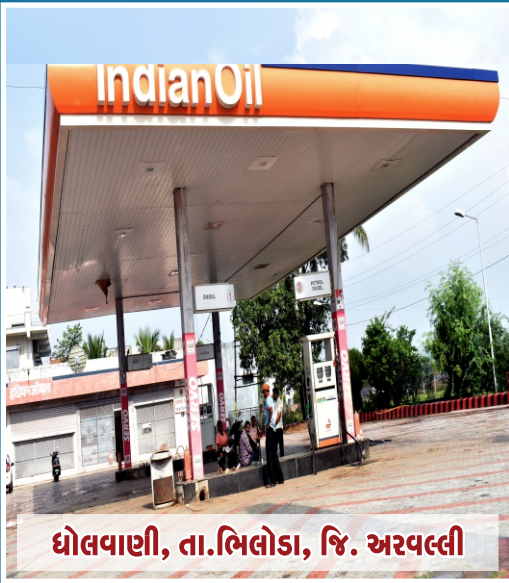
ધોલવાણી, તા.ભિલોડા, જિ. અરવલ્લી