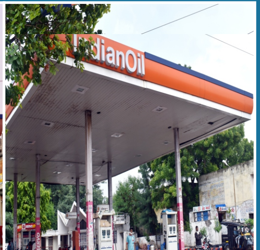
ભિલોડા, જિ. અરવલ્લી