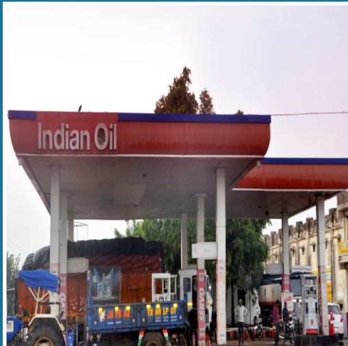
ગાંભોઈ, તા. હિંમતનગર, જિ. સાબરકાંઠા.