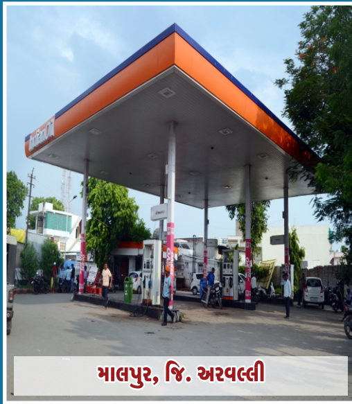
માલપુર, જિ. અરવલ્લી