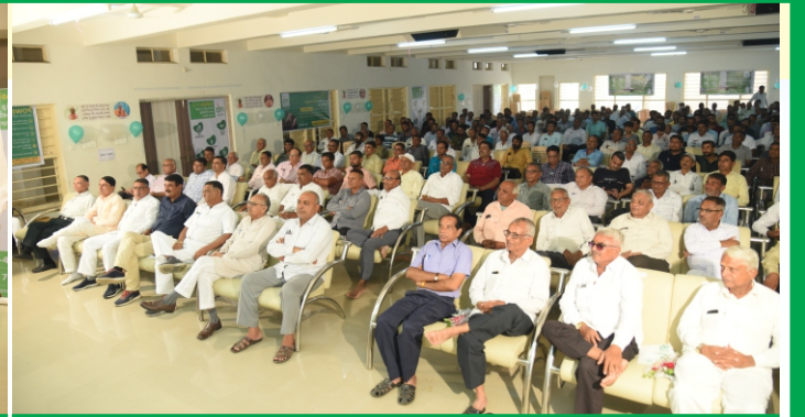
સેમીનારમાં ઉપસ્થિત મહેમાનો