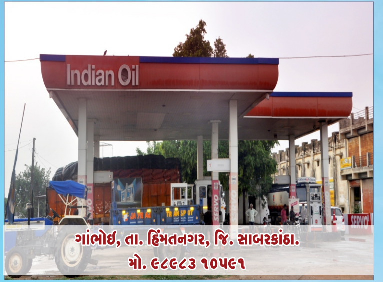
ગાંભોઈ, તા. હિંમતનગર, જિ. સાબરકાંઠા. મો. ૯૮૯૮૩ ૧૦૫૯૧