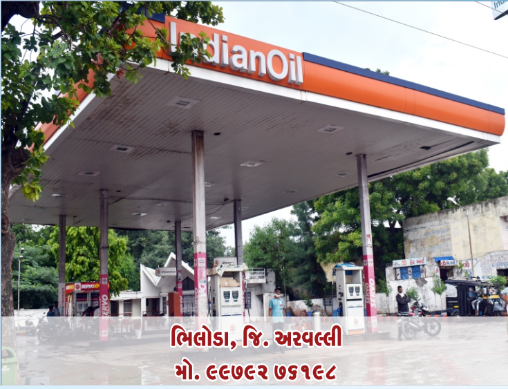
મિલોડા, જિ. અરવલ્લી મો. ૯૯૭૯૨ ૭૬૧૯૮