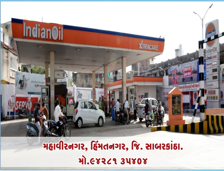
મહાવીરનગર, હિંમતનગર, જિ. સાબરકાંઠા. મો.૯૪૨૮૧ ૩૫૪૦૪