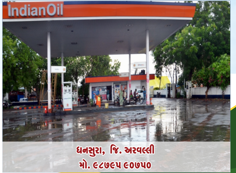
ધનસુરા, જિ. અરવલ્લી મો. ૯૮૭૯૫ ૯૦૭૫૦