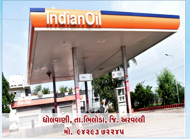
ધોલવાણી, તા.મિલોડા, જિ. અરવલ્લી મો. ૯૪૨૯૩ ૭૨૨૪૫