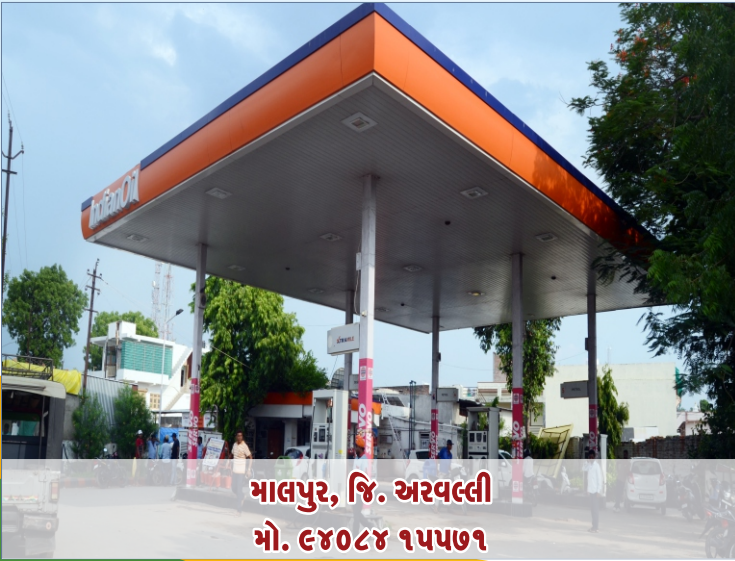
માલપુર, જિ. અરવલ્લી મો. ૯૪૦૮૪ ૧૫૫૭૧